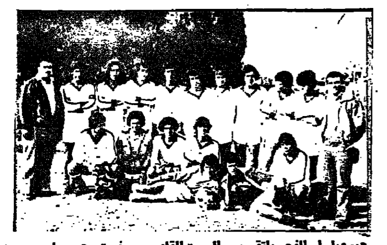
هوبويل ام الفحم يلتقي يوم السبت القادم مع فريق هوبويل معين دالية الكرمل ضمن الدرجة الثانية ..

على استاد رمات غان يلتقي المنتخب الوطني الاسرائيلي مع فريق ساوتهمبتون في ٢٨ من الشهر الجاري . ويجري المنتخب الوطني الاسرائيلي هذه المباراة الودية في نطاق الاستعدادات للقاء مع منتخب السويد في الشهر القادم .